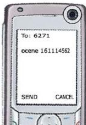
ПРИМЕР УПИТНЕ ПОРУКЕ ЗА СМС ПРЕГЛЕД ОЦЕНА

Када је већ формирана база оцена на Интернету, у сарадњи са „Телекомом Србија“, направили смо одличан сервис, који ђацима и родитељима без компјутера, дозвољава преглед оцена путем СМС порука. Наиме, слањем СМС поруке: ОЦЕНЕ ПИНКОД (где је ПИНКОД јединствен за сваког ученика) на посебан број телефона, особа ће примити све средње оцене за сваки предмет тог ученика. Претпоставка је да је ПИН код тајна ствар сваког ученика. Слањем СМС поруке: ОЦЕНЕ ПИНКОД ПРЕДМЕТ , заинтересовани ће добити све појединачне оцене тог предмета. Ево неких шифри за ПРЕДМЕТ : (математика – mat, српски језик – srp, физика – fiz, хемија – hem, биологија – bio, географија – geo, историја – ist, ликовно – lik, вероанаука – ver, грађанско – gra, енглески – eng, немачки – nem, француски – fra, фискултура – fis, техничко – teh, музичко – muz, владање – vla (за владање ћете примити напомене о понашању ученика са његовим изостанцима) !